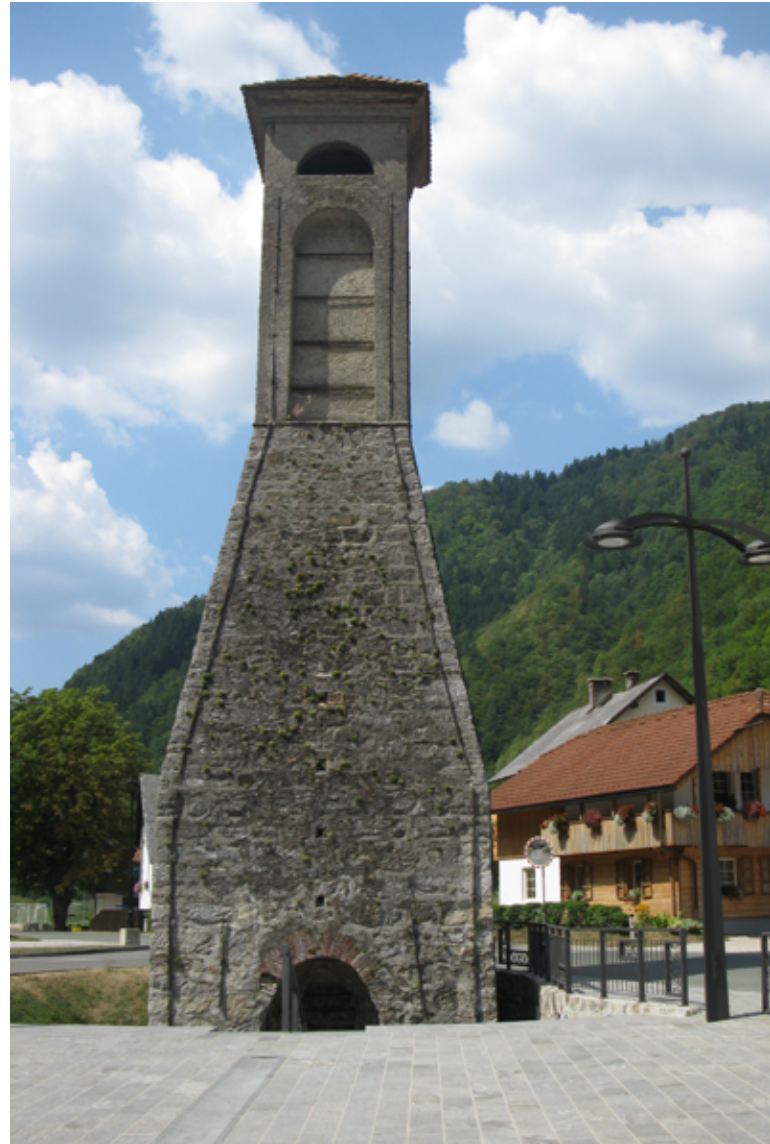
Abb.1: Hochofen in Zelezniki Fig.1: Blast furnace Železniki Slika 1: Plavž v Železnikih

Die Schlacken aus den frühhistorischen Öfen stammend enthalten ca. 50 Gewichts-% Eisen, das in Fayalit und/oder Wüstit gebunden ist. Diese Schlacken wurden als Rohstoff für die Eisenherstellung im Hochofen verwendet. Das Bild 2 stellt ein Mikrogefüge, Fayalit und Dendriten von Eisenoxid, einer solcher Schlacke dar.