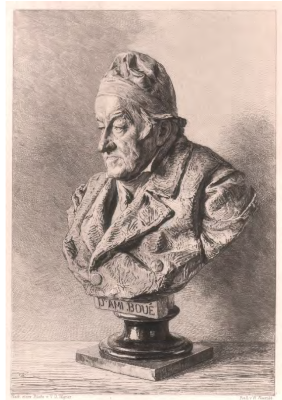
Fig. 1: Bust of Ami BOUÉ / Busto di Ami BOUÉ / Büste Ami BOUÉS

Sandra B. WEISS, Wien, sw@sandra-weiss.at