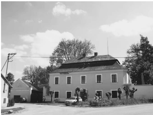
Fig. 1: Birthplace of / Geburtshaus von / Friedrich SIMONY in Hrochův Týnec.

Auch in seinen Kindheits- und Jugendjahren – SIMONYS Mutter verstarb bereits um 1820 ohne seinen Vater geheiratet zu haben – förderte immer wieder eine unbekannt Person (? Institution) sein „mehr als standesgemäßes“ Fortkommen. Nach dem frühen Tod der Mutter nahm sich ein Onkel um die weitere Erziehung Friedrichs an.