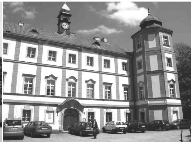
Fig. 2: In the castle Zámrsk is the east-bohemian state-archive. / Im Schloss Zámrsk befindet sich das ostböhmisches Staatliche Gebietsarchiv.

An die Rückseite des feudalen, 1747 erbauten barocken Geburtshauses und Nebengebäudes schließt ein parkähnliches Grundstück an, das von einer Steinmauer umgeben wird. Das Anwesen befindet sich in Privatbesitz.