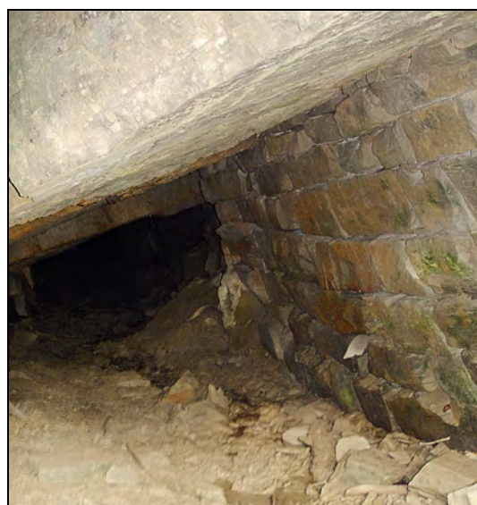
Abb. 7: Mundloch eines der Stollen am Bäckerberg.

Auf dem Kartenblatt existieren mehrere Mundlöcher solcher Abbaue am Fuß des Bäckerberges gegenüber Steinbachbrücke, die zur Erzeugung von Schleif- und Wetzsteinen für den lokalen Bedarf angelegt wurden. Mehrere, weitgehend verstürzte Stolleneingänge wurden im Zuge der Kartierung am Bäckerberg gefunden. Historisch bekannt ist ihre Gewinnung aus einem Steinbruch (40m lang und 6–9m hoch) und einem später, im Jahre 1946, angelegten Stollen. Laut Kieslinger wurde dieser gegen NW vorgetrieben und dann nach N umgelenkt und hat ca. 91m Länge, 20m Breite und 3m Höhe. Der Stollen folgt streng dem Streichen einer Sandsteinbank, und zwar der oberen, gleichkörniger ausgebildeten Hälfte. Die Firste wird von der überlagernden Sandsteinbank gebildet (Abb. 7). Die mergeligen Zwischenbänke sowie grobe, ungleichkörnige Sandsteine finden sich als Versatzstücke und dienen auch als Mauer- und Bruchsteine, weiters Grabsteine und Sockelverkleidungen. Der unterirdische Abbau erfolgte mit händisch geschrämmt Schlitzten. Auch in HANISCH & SCHMID (1901) sind ehemals für Mauerstein genutzte Sandsteinbrüche bei Viechtwang erwähnt (MOSHAMMER, in EGGER et al., 2007).