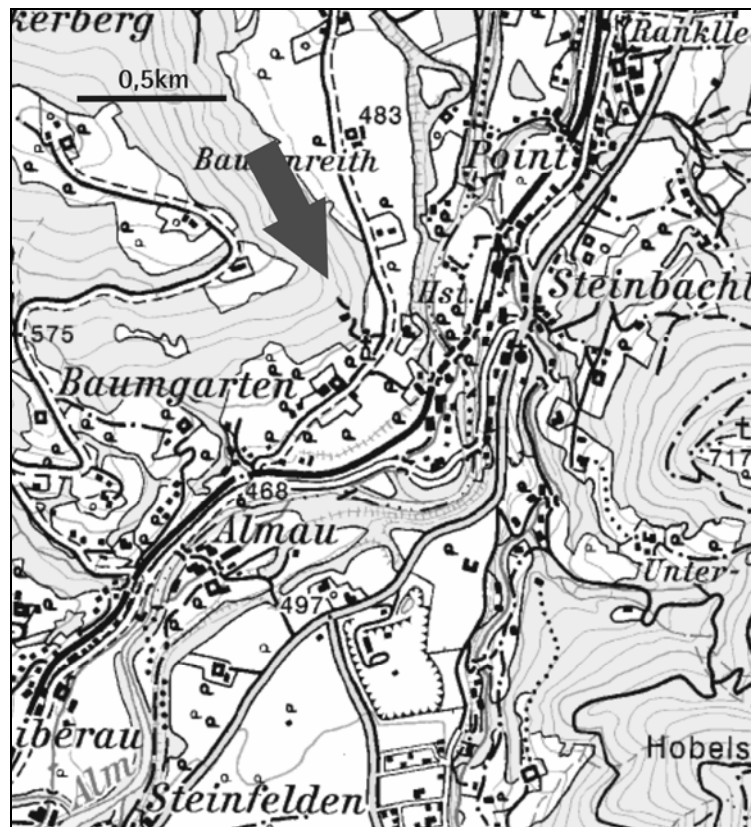
Abb. 5: Lage des Haltepunkts am Bäckerberg.

Thema: Altenglach-Formation (Roßgraben-Subformation, oberes Campanium), Schleifsteinabbau