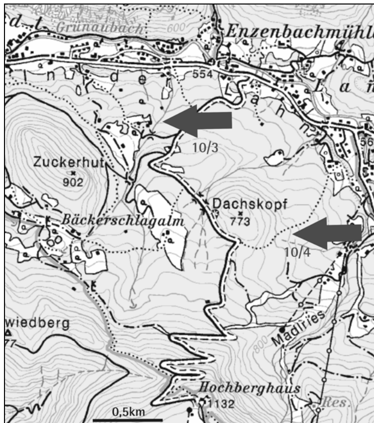
Abb. 8: Lage der Haltepunkte im Grünauer Halbfenster.

Haltepunkt 10/3: Grabeneinschnitt E Zuckerhut zwischen 640m und 660m Seehöhe (ca. 2 km E Grünau)