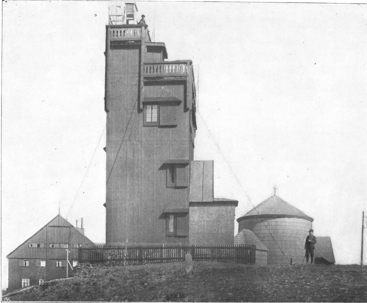
Das meteorologische Observatorium auf der Schneekoppe.